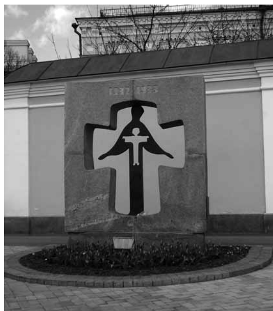
Mahnmal in Kiew für die Opfer des Hunger-Genozids „Holodomor“.

Ein trinationales Holocaustprojekt für deutsche, kanadische und polnische Studierende wurde 2007 zum vierten Mal in Folge durchgeführt. Inzwischen sind über 150 junge Lehrerinnen und Lehrer aus diesen drei Ländern in dem Projekt qualifiziert worden. Es besteht ein internationales Netzwerk, das 2008 mit einer Internetplattform den Austausch von Lehrerfahrten und Lehrmaterialien weiter vorantreiben soll. Das Projekt wird primär aus Drittmitteln finanziert und hat inzwischen ein Gesamtvolumen von etwa 1,2 Millionen Euro erreicht. Die Finanzierung durch deutsche und internationale Stiftungen, aber auch durch Privatpersonen, unterstreicht seinen Erfolg. Federführende Partnerinstitution ist die York University in Toronto mit den Professoren Mark Webber und Michael Brown. 2007 wurde das Projekt erstmals auch vom Ministerium für Wissenschaft, Forschung und Kunst Baden-Württemberg finanziell unterstützt.