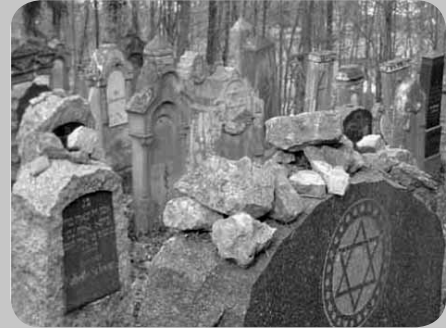
Der jüdische Friedhof in Rexingen.

Es scheint, dass sich mit dem Beschluss des Bundestages zur Errichtung eines Einheits-Denkmal ein geschichtspolitischer Bogen schließt. Wurden Gedenkstätten früher bisweilen als (Un-)Orte der „negativen Erinnerung“ eingeschätzt, sind sie heute sowohl Mahnmale für eine schreckliche Vergangenheit, die sich nicht verdrängen lässt, als auch Nachweis dafür, dass man mit dieser offen und zukunftsgerichtet umgehen kann. Das in ihnen erbrachte bürgerschaftliche Engagement, anfangs des öfteren bekämpft, später dann vielfach hoch gelobt, schafft den Grund für eine freiheitliche und demokratische Erinnerungskultur, die sich im Klaren ist über ihre Vergangenheit und damit der Zukunft zuwenden kann. Aleida Assmann, Professorin für Anglistische und Allgemeine Literaturwissenschaft an der Universität Konstanz, interpretierte dieses Engagement auf dem 77. Deutschen Archivtag 2007 in Mannheim als „Demokratisierung durch Ehrenamtlichkeit“.