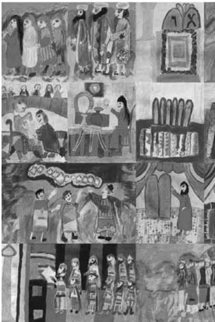
Titelbild-Illustrationen wurden von Kindern der zweiten Grundschulklasse von Horb-Rexingen gemalt.

und lernen, die fremden Symbole auf jüdischen Grabsteinen zu verstehen. Angesichts wiederkehrender Schändungen jüdischer Friedhöfe ist es eine wichtige Aufgabe, diese als „zugehörige Orte“ kennen zu lernen. Die Hefte sind so aufgebaut, dass sie durch Einfügen weniger Bilder per Computer ohne großen Aufwand auf jeden der 144 jüdischen Friedhöfe im Land zugeschnitten werden können. Ein Teil der Illustrationen wurde von Kindern der zweiten Grundschulklasse von Horb-Rexingen gemalt. Beide Hefte sind bei der LpB erhältlich.