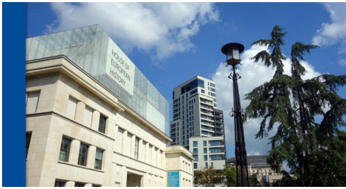
(Haus der Europäischen Geschichte in Brüssel. Foto LpB)

(Luxemburg), Brüssel (Belgien) sowie nach Kamp Vught und Westerbork (Niederlande). Das Programmangebot richtet sich an Gedenkstättenmitarbeitende.