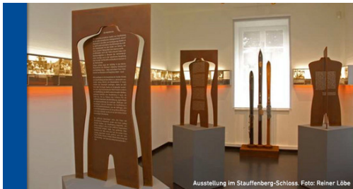
Blick in die Ausstellung im Stauffenberg-Schloss.

Mut bewiesen – Widerstand gegen den Nationalsozialismus u. Zivilcourage heute