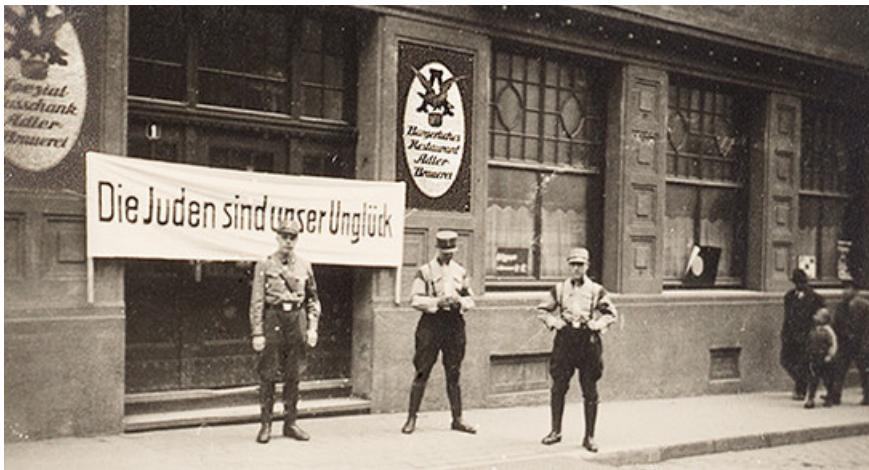
1. April 1933: SA-Posten vor dem Eingang zur Adler-Brauerei in Heilbronn.