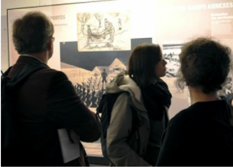
Materialien zum KZ-Natzweiler.