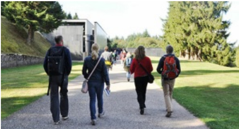
Auf dem Weg zum ehemaligen KZ-Natzweiler.